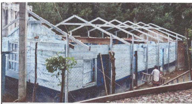
Foto 5: Sustitución de lámina, por lámina troquelada aluzinc calibre 26