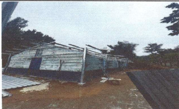
Foto 1: Sustitución de lámina, por lámina troquelada aluzinc calibre 26