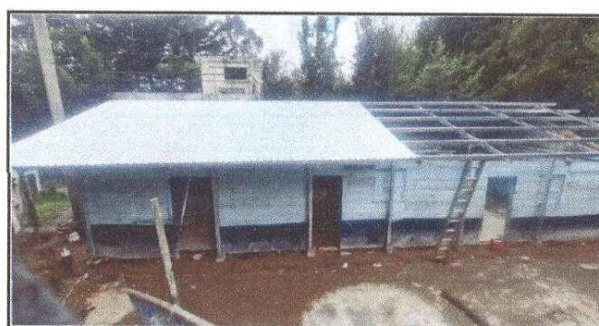
Foto 6: Sustitución de estructura de soporte de madera, por metal

Observación: Si es necesario se pueden agregar hojas adicionales y actualizar el número de hojas.