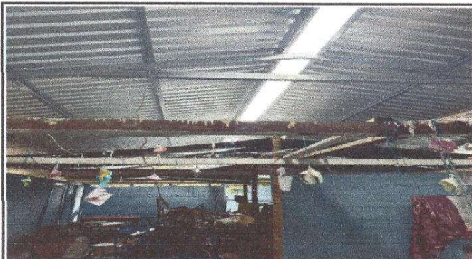
Foto 3: Sustitución de estructura de soporte de madera, por metal